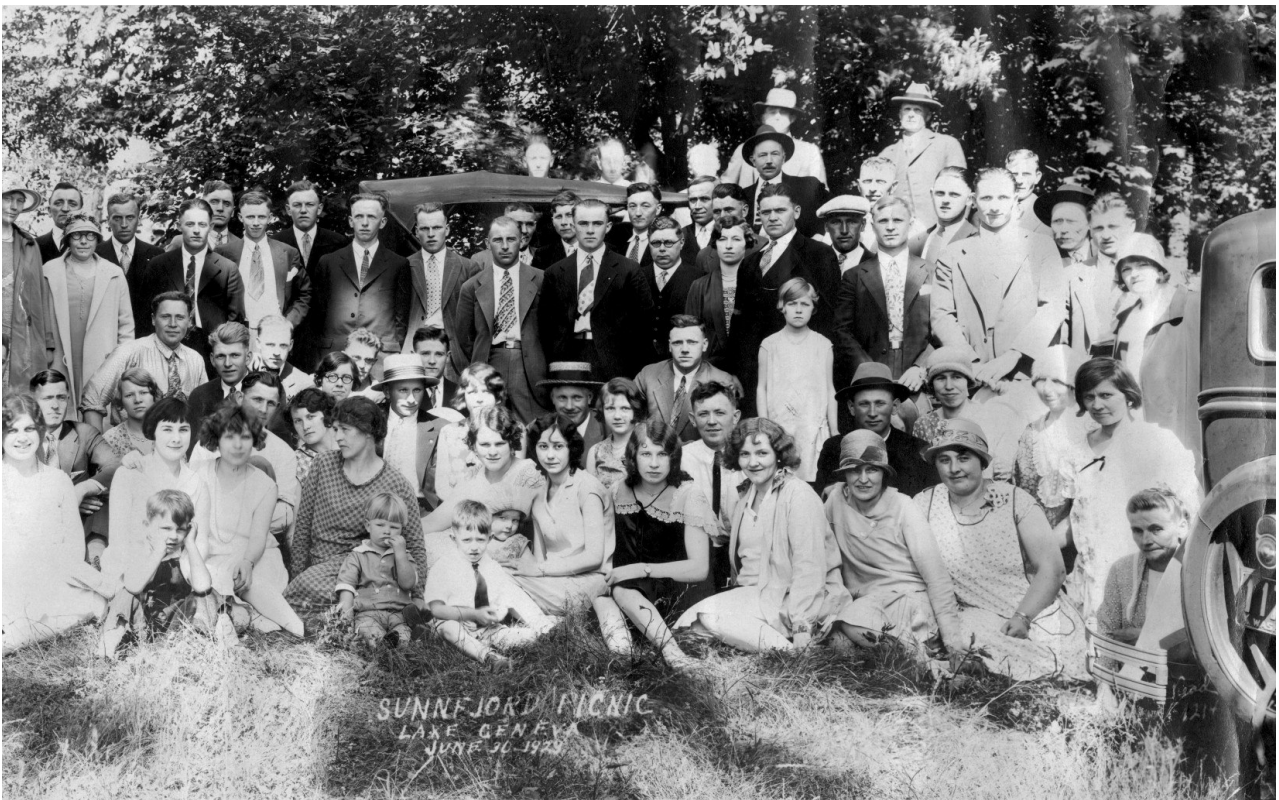
Sunnfjord-Picnic at Lake Geneva 30 June 1929