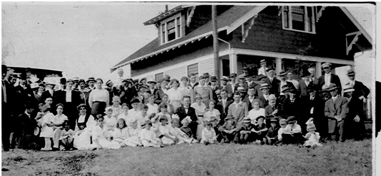
Sunnfjordstemne at P I Berg`s house ca 1917 or later.