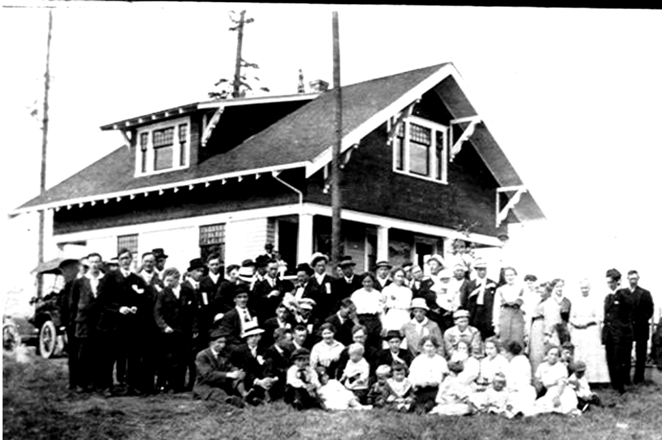
Stemne at P I Berg`s house. Time i s unknown